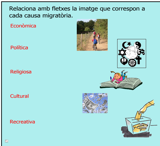
Activitat de causes