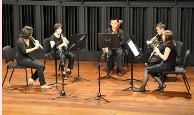
EL QUINTET DE VENT

Recordes el nom d'aquestes agrupacions musicals?