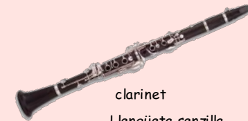
clarinet Llengüeta senzilla de canya