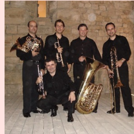
EL QUINTET DE METALL