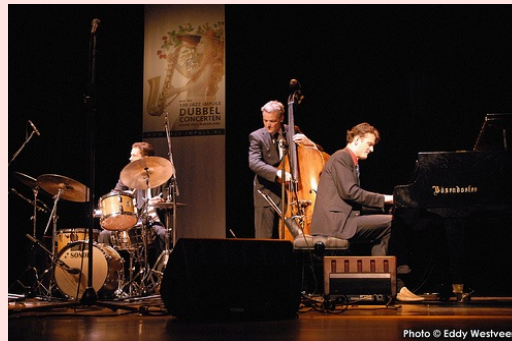
trio de jazz: piano, bateria i contrabaix

està format per un piano, un contrabaix i una bateria.