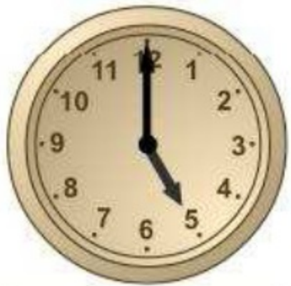
les cinc en punt