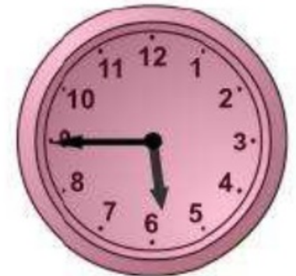
tres quarts de sis