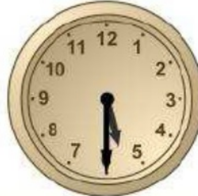
dos quarts de sis